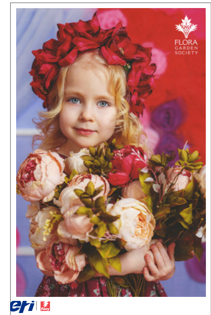
MIT FIERY TECHNOLOGIE