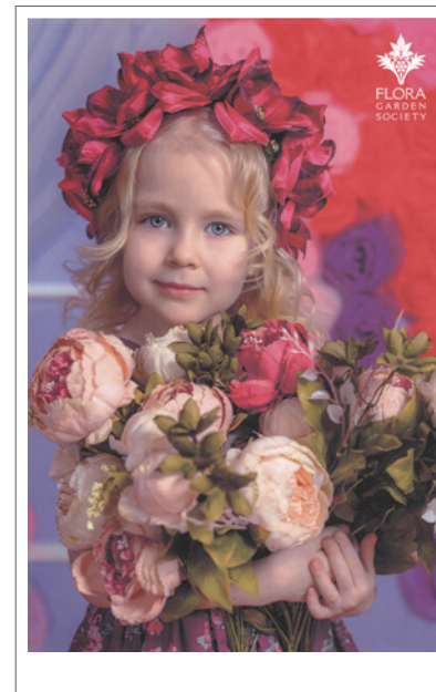
OHNE FIERY TECHNOLOGIE