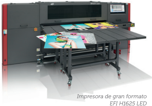
Impresora de gran formato EFI H1625 LED

Se trata de la solución perfecta cuando la calidad de imagen y la rapidez son esenciales para cumplir los requisitos de los clientes que encargan tanto carteles y expositores tradicionales como productos personalizados o especiales.