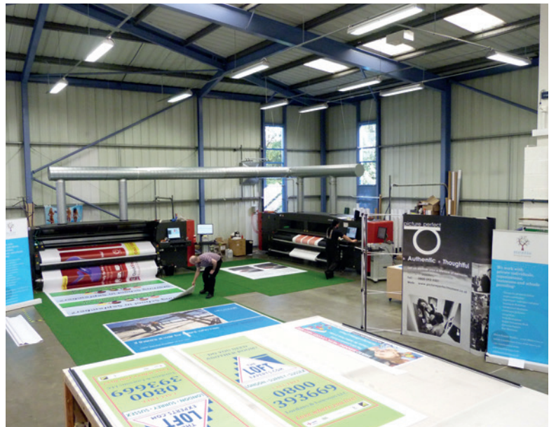
Heute hat Venture mehrere Maschinen und Mitarbeiter in allen Bereichen, von der Produktion bis zur Webentwicklung.