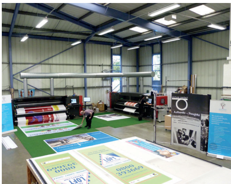
À l'heure actuelle, Venture possède plusieurs machines et du personnel capable de gérer l'ensemble des tâches, depuis la production jusqu'au développement Web.

ANDY WEBB, GESTIONNAIRE DU RIP VENTURE BANNERS